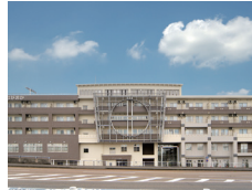
健康の駅ながおか