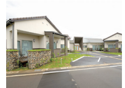
サポートセンター摂田屋