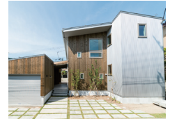
アーキテクトラボ