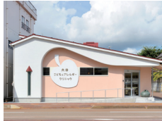
太田子どもとアレルギークリニック