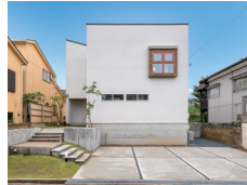
夕焼けテラスの家