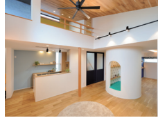
まんまるヌックと展望デッキ