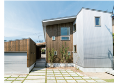
アーキテクトラボ